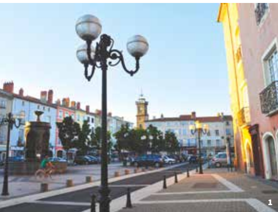
1. Place de la République, Grande Place 2. Boulevard de la Manlière, vue ancienne