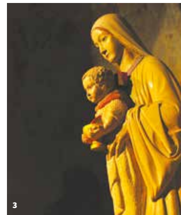
3. Crypte de l'abbatiale, Notre-Dame du Précieux Sang, 1943 4. Issoire, vue aérienne