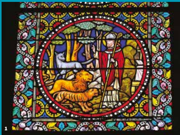
1. Vitrail de saint Austremon 2. Plan de l'abbaye au 17 e siècle

Au nord de l'église, le tracé des rues du Chastel et Auguste Bravard, conserve le souvenir d'une enceinte protégeant le monastère et un bourg civil. Ce noyau primitif était renforcé par une motte castrale, dont la forme est suggérée par la rue Saint-Paul.