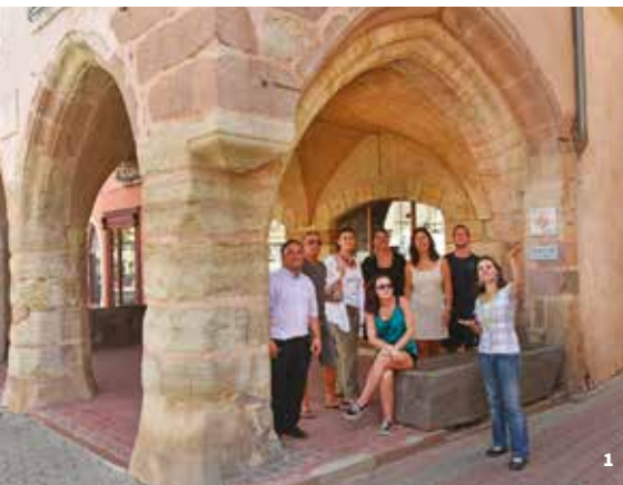
1. Maison aux Arcades