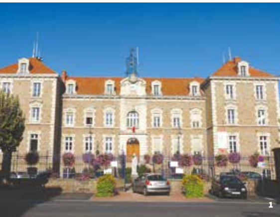
1. Hôtel de Ville